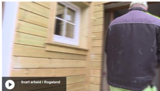
Svart arbeid i Rogaland

Den største aksjonen noensinne mot kriminalitet i byggebransjen er nettopp avsluttet i Stavanger. 2000 arbeidere ble kontrollert.